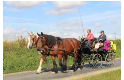
Un attelage en paire sur une randonnée de 7jours.

Sortie montée attelée à la journée, une journée pour se ressourcer.