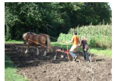
Formation professionnelle en traction animale, ici le maréchage

Gérer et entretenir ses pâtures Comment optimiser la pousse de l'herbe en préparant la prairie à passer l'hiver.