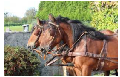
Un attelage en paire sur une sortie à la journée

Rien de tel pour faire une bonne progression dans votre pratique de l'attelage.