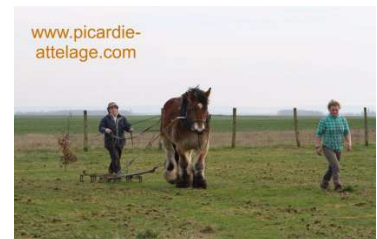
Stage de traction animale

11 mars Vous avez des chevaux, et des pâtures mais elles produisent de moins en moins d'herbe de qualité ou entraînent des fourbures. Vous pouvez y remédier. ;)