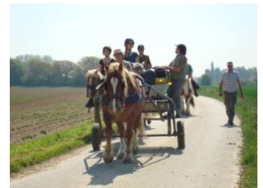
Randonnée de 3 jours, en attelage et à cheval

Ces 5 jours de randonnée itinérante, à cheval ou en attelage, vous y aideront.