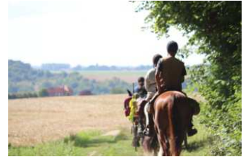
Randonnée de 7 jours à cheval et en attelage.

Stage d'attelage : initiation au tandem attelé. L'équipage le plus technique à conduire !