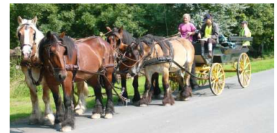
Un attelage à 4 chevaux sur une randonnée de 6 jours.