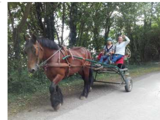
Cours d'attelage en simple de 2h

Pour se sentir plus à l'aise en extérieur sur des chemins étroits, abimés, en circulation, et travailler la maniabilité de vos chevaux, attelés, aux longues rênes, en main ou en selle.