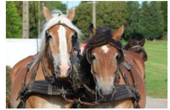
Un attelage en paire sur une sortie à la journée

Pour se sentir plus à l'aise en extérieur sur des chemins étroits, abimés, en circulation, et travailler l'agilité de vos chevaux, attelés, aux longues rênes, en main ou en selle.