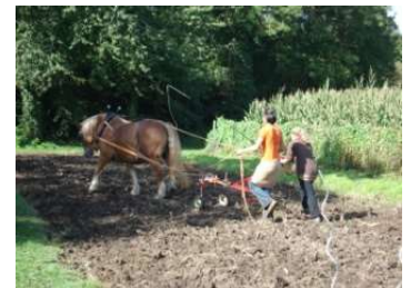
Formation professionnelle en traction animale, ici le maréchage

22 sept Comment optimiser la pousse de l'herbe en préparant la prairie à passer l'hiver.