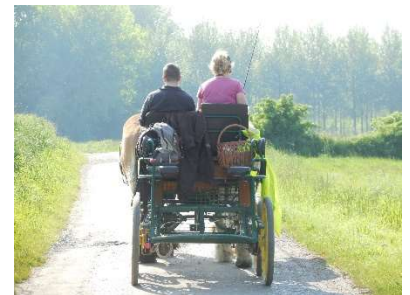
Randonnée à la journée

Sortie montée attelée à la journée, une journée pour se ressourcer.