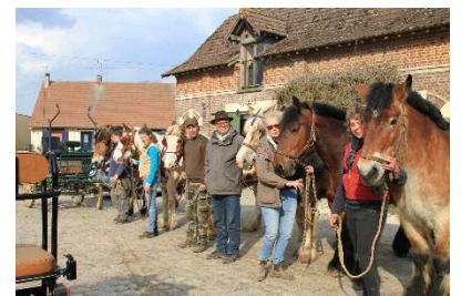
Stage à la semaine 2018

Rien de tel pour faire une bonne progression dans votre pratique de l'attelage.