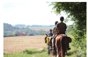
Randonnée de 7 jours à cheval et en attelage.