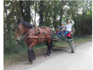
Cours d'attelage en simple de 2h

Ces 5 jours de randonnée itinérante, à cheval ou en attelage, vous y aideront.