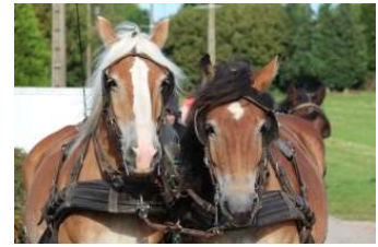
Cours d'attelage en paire

Pour se sentir plus à l'aise en extérieur sur des chemins étroits, abimés, en circulation, et travailler l'agilité de vos chevaux, attelés, aux longues rênes, en main ou en selle.