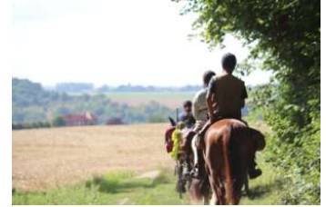
Randonnée de 7 jours à cheval et en attelage.

Stage : Le travail en liberté ou le tact équestre (niveau 2)