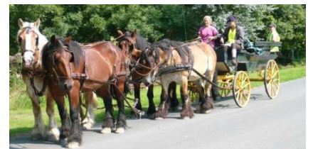
Cours d'attelage à 4 chevaux

Vous découvrirez les bases méconnues de la communication avec votre cheval. Sans artifices.