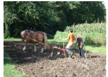
Formation professionnelle en traction animale, ici le maréchage

Gérer et entretenir ses pâtures Comment optimiser la pousse de l'herbe en préparant la prairie à passer l'hiver.