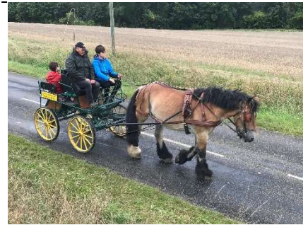
Stage d'initiation à l'attelage

Randonnée pédestre avec équidés de bât pour porter vos sacs à dos.