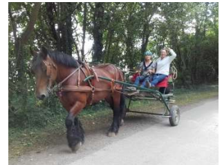
Cours d'attelage en simple de 2h

Sortie en selle ou en calèche à la journée, une journée pour se ressourcer.