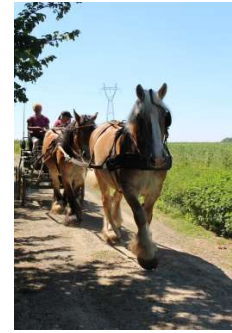
Cours en tandem attelé

Pour se sentir plus à l'aise en extérieur sur des chemins étroits, abimés, en circulation, et travailler la souplesse et réactivité de vos chevaux, attelés, aux longues rênes, en main ou en selle.