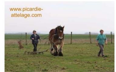
Stage de maraichage

Vous avez des chevaux, et des pâtures mais elles produisent de moins en moins d'herbe de qualité ou entraînent des fourbures. Vous pouvez y remédier. ;)