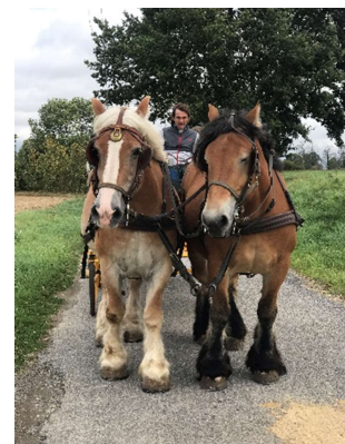
Stage d'attelage en paire

16 Janv Stage d'attelage : Le débardage, pour vous permettre d'entretenir vos terrains tout en passant du temps avec votre cheval, le côté pratique des chevaux d'attelage. Apprenez à tirer du bois avec un cheval.