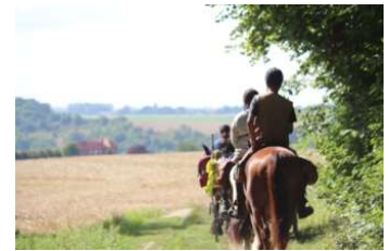
Randonnée de 7 jours à cheval et en attelage.