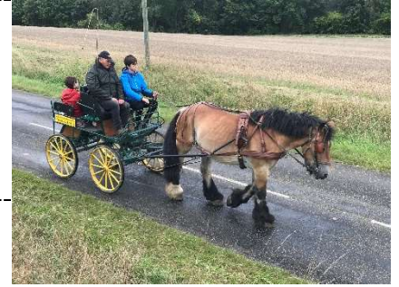
Stage d'initiation à l'attelage

27 Août Découvrez ce qu'est la conduite d'un attelage