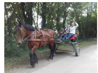
Cours d'attelage en simple de 2h