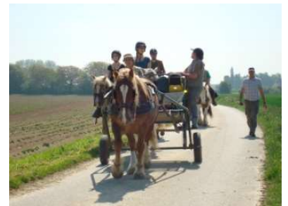
Randonnée de 3 jours, en attelage et à cheval

Rien de tel pour faire une bonne progression dans votre pratique de l'attelage.