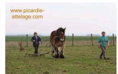
Stage de maraichage

12 mars Vous avez des chevaux, et des pâtures mais elles produisent de moins en moins d'herbe de qualité ou entraînent des fourbures. Vous pouvez y remédier. ;)