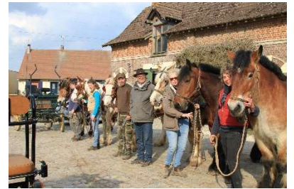
Stage à la semaine 2018

Rien de tel pour faire une bonne progression dans votre pratique de l'attelage.