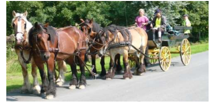
Cours d'attelage à 4 chevaux

Vous découvrirez les bases méconnues de la communication avec votre cheval. Sans artifices.