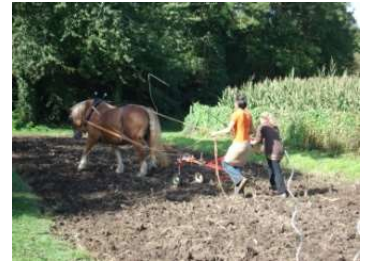
Formation professionnelle en traction animale, ici le maréchage

Gérer et entretenir ses pâtures Comment optimiser la pousse de l'herbe en préparant la prairie à passer l'hiver.