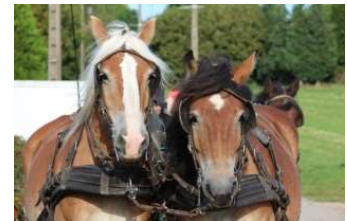
Cours d'attelage en paire

Pour se sentir plus à l'aise en extérieur sur des chemins étroits, abimés, en circulation, et travailler l'agilité de vos chevaux, attelés, aux longues rênes, en main ou en selle.