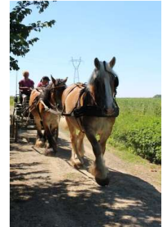
Cours en tandem attelé

12 Fev Pour se sentir plus à l'aise en extérieur sur des chemins étroits, abimés, en circulation, et travailler la souplesse et réactivité de vos chevaux, attelés, aux longues rênes, en main ou en selle.