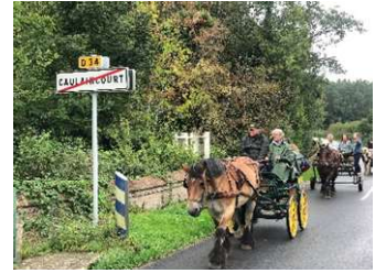
Stage d'initiation à l'attelage

Découvrez ce qu'est la conduite d'un attelage